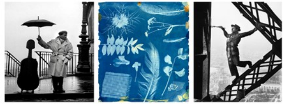
Robert Doisneau 1957